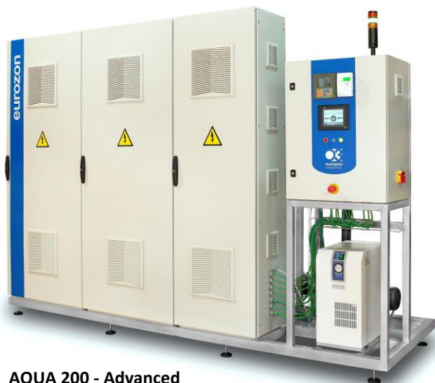
AQUA 200 - Advanced