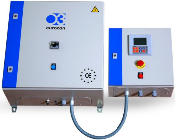
AQUA LINE 30 - Basic