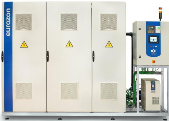
AQUA 200 - Advanced

Se conecta el sistema de Ozonización al depósito del cliente. El sistema de recirculación integrado del AQUA - Plus, obliga al agua del depósito a pasar a través de un inyector Venturi, mediante el cual, inyectamos el Ozono producido, en el agua del depósito. De esta forma, aplicamos la dosis de Ozono bien dimensionada al agua del depósito (ver manual de usuario).