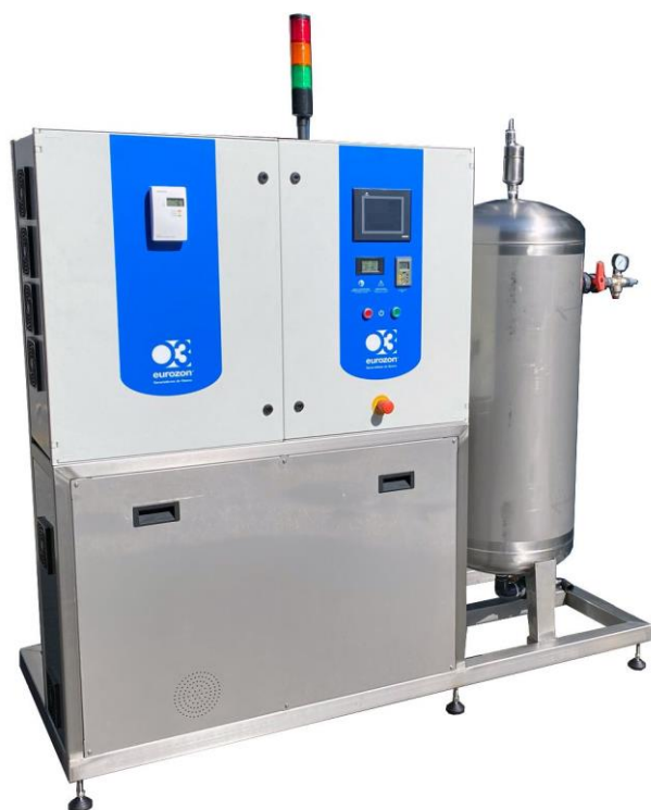
AQUA PRO 50 - Advanced