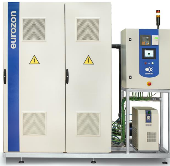
META 150 Advanced