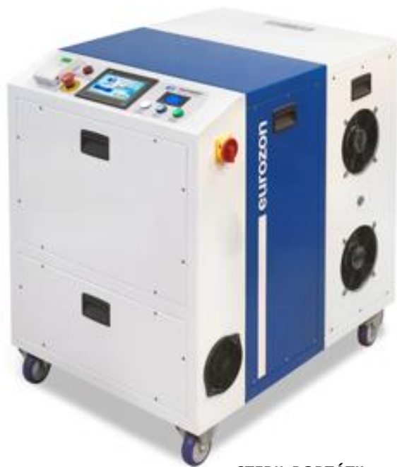
STERIL PORTÁTIL G60 - Advanced

El equipo se sitúa en el interior del espacio a tratar, se conecta a la red eléctrica y se programa el tiempo de tratamiento. Nunca debe haber seres vivos presentes durante el tratamiento. Sólo se debe entrar en la estancia una vez transcurrido el tiempo programado, y cuando la alarma acústica-luminosa del equipo deje de emitir señal, siendo la concentración de Ozono en aire segura (Ver manual de usuario).