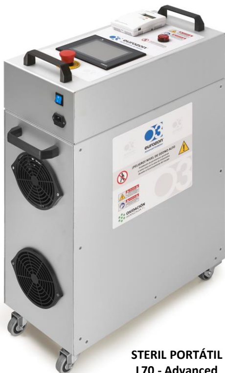
STERIL PORTÁTIL L70 - Advanced